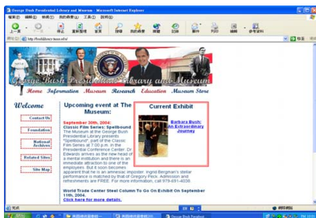
圖三：George Bush Presidential Library and Museum