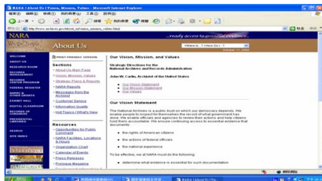
圖一：NARA：About Us: Vision, Mission, Values