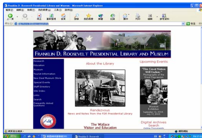
圖二：Franklin D. Roosevelt Presidential Library and Museum

於 1939 年奠基，1940 年完工。位於紐約海德公園中，佔地十六英畝，由羅斯福總統及其夫人所捐贈給聯邦政府。該建築由羅斯福總統本人設計，採荷蘭殖民地之建築風格。該館為美國最早成立的總統圖書館，還設立一所博物館。陳列總統的禮物與物品。博物館於 1941 年開放民眾參觀，該館資料也於 1946 年提供學者作研究 ( Franklin D. Roosevelt Presidential Library and Museum , 2004)。