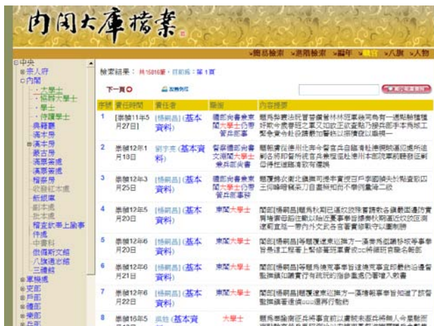
圖 3 明清檔案中央職官排序樣式

制)，這樣的資訊脈絡，原分散於史料與史學著作中，經由史學專家的整理，形成清楚的體制脈絡(見圖 3)。