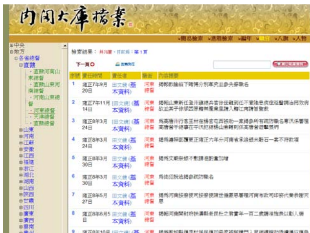
圖 4 明清檔案地方職官排序樣式

非以一行政區對應一總督(康熙四年訂立二省一總督原則)(明清檔案工作室, 2008b) 因此，在地名之前，提列職官類屬，再行序列(見圖 4)。