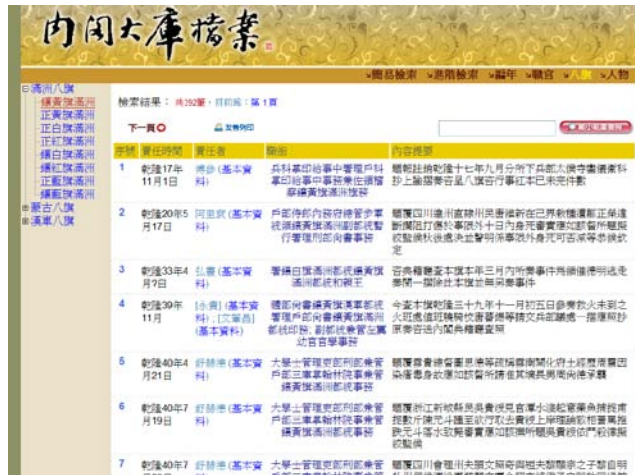
圖 5 明清檔案八旗排序樣式

單獨認定其為軍制(兵制)(張藝曦, 2003)，在此 提供其瀏覽脈絡，主因漢人有所屬籍貫，但滿 人則以屬旗作為出身脈絡(見圖 5)。