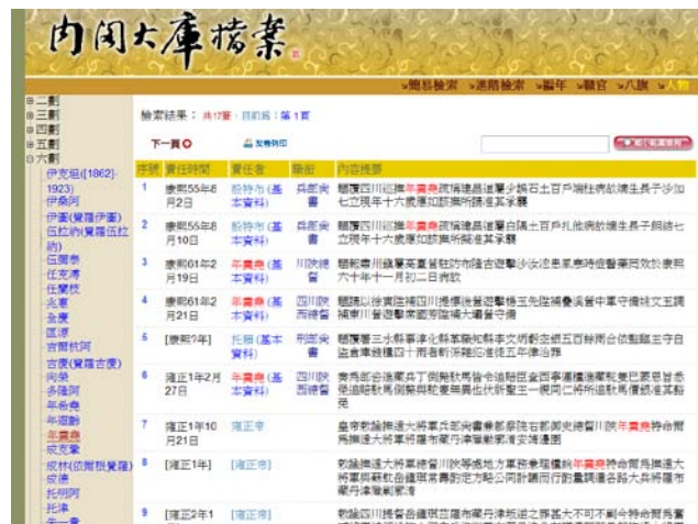
圖 6 明清檔案人物排序樣式