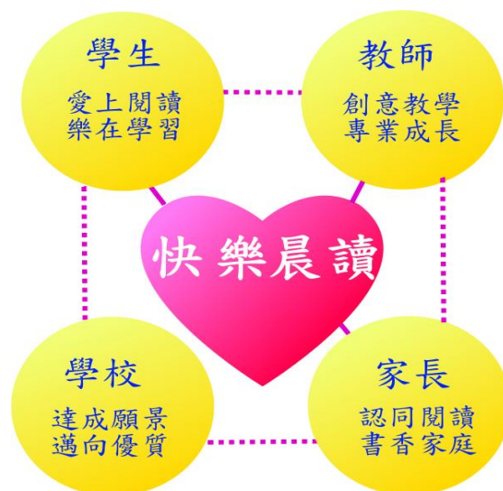
圖 1 快樂晨讀的目標