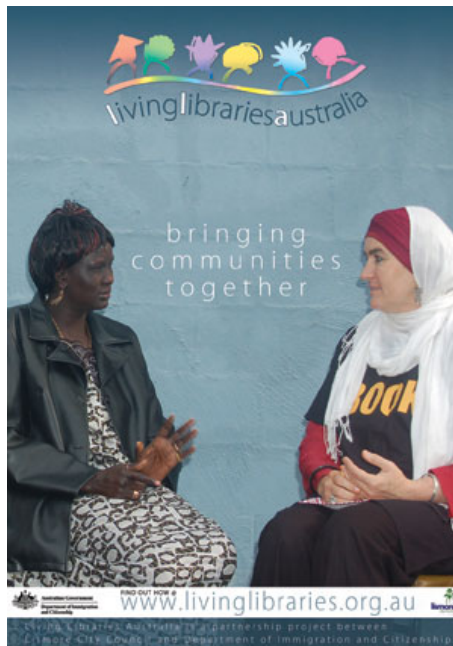
圖 1 澳洲 Lismore's living library 海報

真人圖書館的理念也被衍生應用於國小教育。例如加拿大哥倫比亞省智利城鄉 (Chilliwack, British Columbia, Canada)，為改善小學生口語技巧，邀請真人圖書館到教室為小朋友說故事。他們相信每個人都有精彩的故事可以分享，這樣的活動有助於讓小朋友了解多元的世界觀和生活經驗、自己也是有故事可以分享、透過說和聽故事增進字彙使用和口語技巧 (The living library project, n.d.)。而從澳洲 Lismore's living library 的海報中，也可看到真人圖書館身穿有「圖書」(book) 字樣的 T 恤，是伊斯蘭教徒，正與讀者對話。(見圖 1)