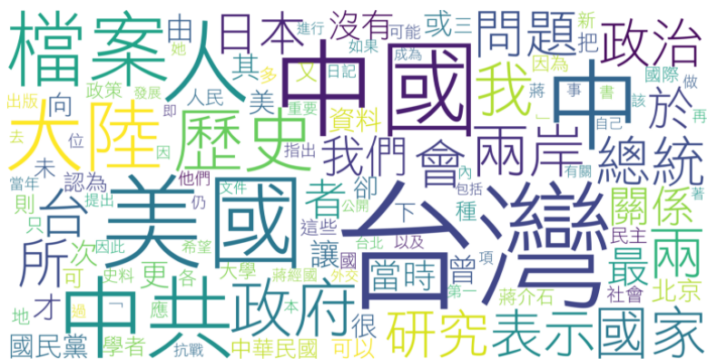
圖 2 選舉期間檔案主題新聞高頻詞統計文字雲

本研究接著分析 1999 年至 2000 年間臺灣 6 個選舉期間檔案主題新聞的文本關鍵字與核心議題，本研究將出現頻率最高的斷詞結果以文字雲視覺化呈現如下圖示（圖 2）：